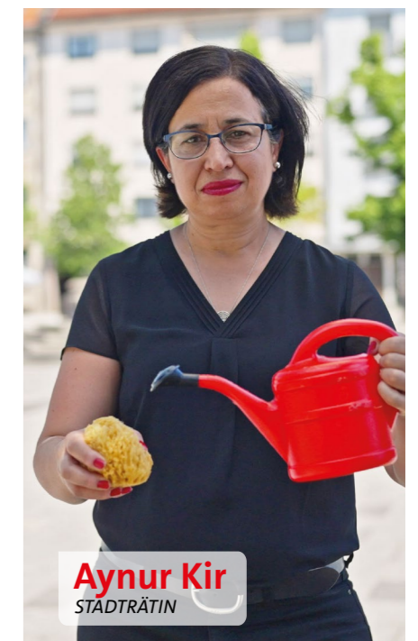
Aynur Kir STADTRÄTIN

Nürnberg ist eine stark versiegelte und dicht bebaute Stadt, deshalb darf das Regenwasser nicht in der Kanalisation verschwinden. Im Sinne des Schwammstadt-konzepts soll das Regenwasser in Schlitzrinnen fließen und von dort zur Bewässerung in nahegelegenen Bäume und Beete geleitet werden.